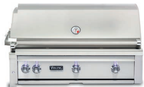
CHURRASQUEIRA S5 Built-in | 42"

Largura: 94 cm Altura: 25,7 cm Profundidade: 64,5 cm