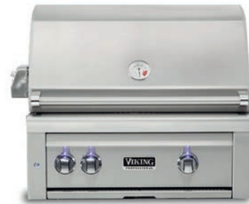
CHURRASQUEIRA S5 Built-in | 30"

Estrutura em aço inox com acabamento premium e alta durabilidade.