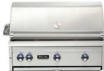
CHURRASQUEIRA S5 Built-in | 36"

Largura: 76,2 cm Altura: 27,6 cm Profundidade: 70,8 cm