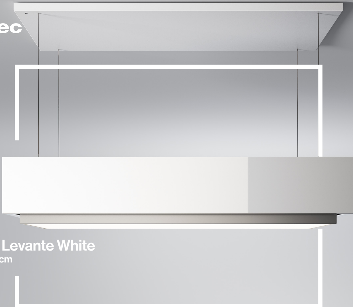
Coifa Levante White Ilha 120 cm