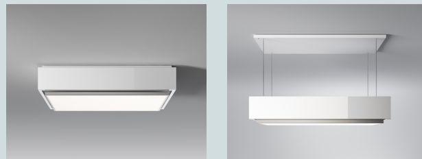
Regulagem de altura: 100 cm